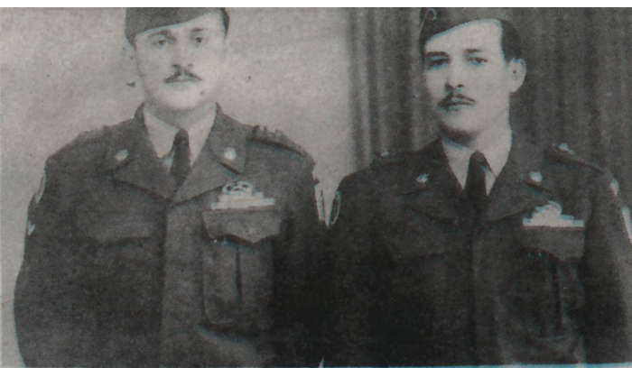
Minami Photo studio Yokohama, Japan 1951

E guera aki a sosode den cuadra di loke a wordo yama Guera Friu, entre Merca y ex Union Sovietico, unda varios pais a participa entre nan Colombia bou e paraplú di Organizacion di Nacionnan Uni (ONU). Un total di 15 pais di henter mundo y e unico pais Latino Americano, esta Colombia a